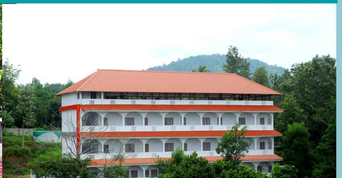
PAVANATMA HOSTEL FOR LADIES