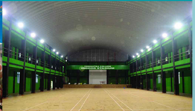
COLLEGE INDOOR STADIUM