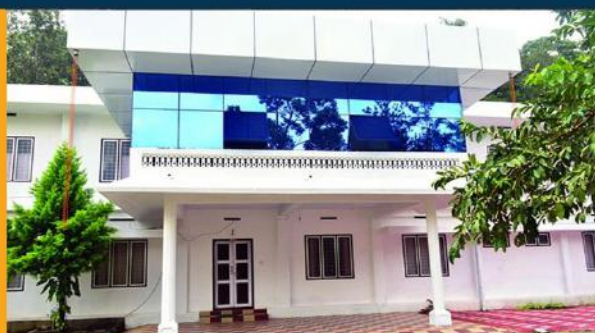
PAVANATMA HOSTEL FOR LADIES