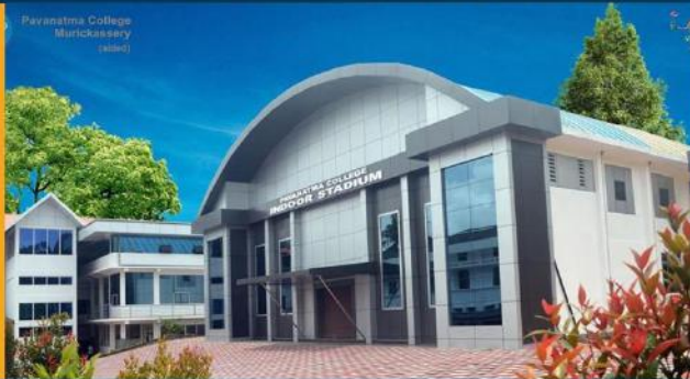
COLLEGE INDOOR STADIUM